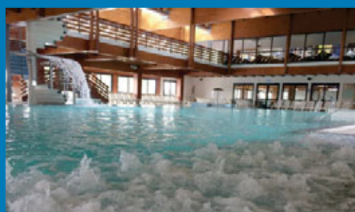
Piscine termali coperte

Lavoriamo soprattutto con clienti italiani, provenienti per lo più da Triveneto, Lombardia e Piemonte, con un livello di fidelizzazione dell'80%.