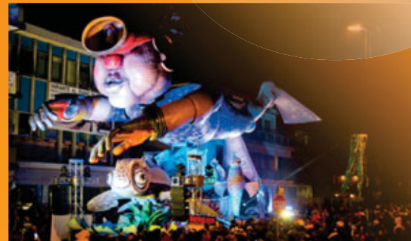
Sempre più Giù / Fantasilandia

L'edizione 2017 se la sono aggiudicata i 20enni Revolution con il carro "L'amor che move il sole e l'altre stelle", ispirato a Dante e a suoi versi, dove è l'amore ad imprimere il movimento agli astri e ad attirare e a far muovere l'universo intero.