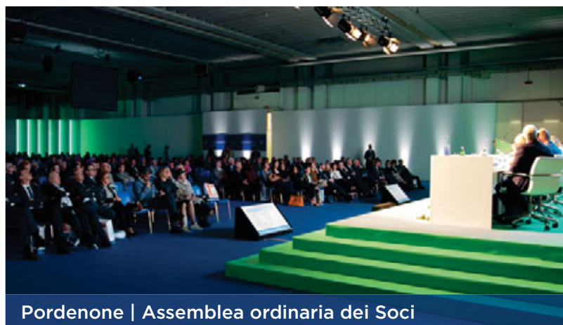
Pordenone | Assemblea ordinaria dei Soci

In fondo rimaniamo sempre "una banca di campagna", con radici salde, conoscenza del territorio, progetti di sviluppo locale, pur con una mentalità di apertura al nuovo che avanza.