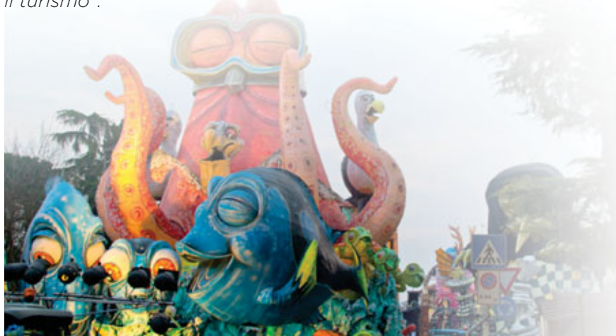
Abbiamo tutti perso la memoria / Rivazancana

“Quella di quest’anno – spiega Gianfranco Moro , presidente dell’associazione Carnevale Ciliense – è stata un’edizione da record, con un pubblico davvero numeroso ed entusiasta. Per la prima volta, inoltre, siamo stati inseriti tra gli eventi del Carnevale Veneziano. La presenza di Luca Zaia, presidente della Regione Veneto, alla sfilata del martedì grasso, ha sancito il valore sociale e storico della manifestazione, a pieno titolo rappresentante della cultura e della tradizione del Carnevale Popolare Veneto. De resto, fra gli obiettivi della nostra associazione c’è quello di rendere il Carnevale dei Ragazzi di Ceggia non solo un evento a carattere locale, bensì un evento di più ampio respiro, che coinvolga persone anche al di fuori del territorio circostante, incentivando il turismo”.