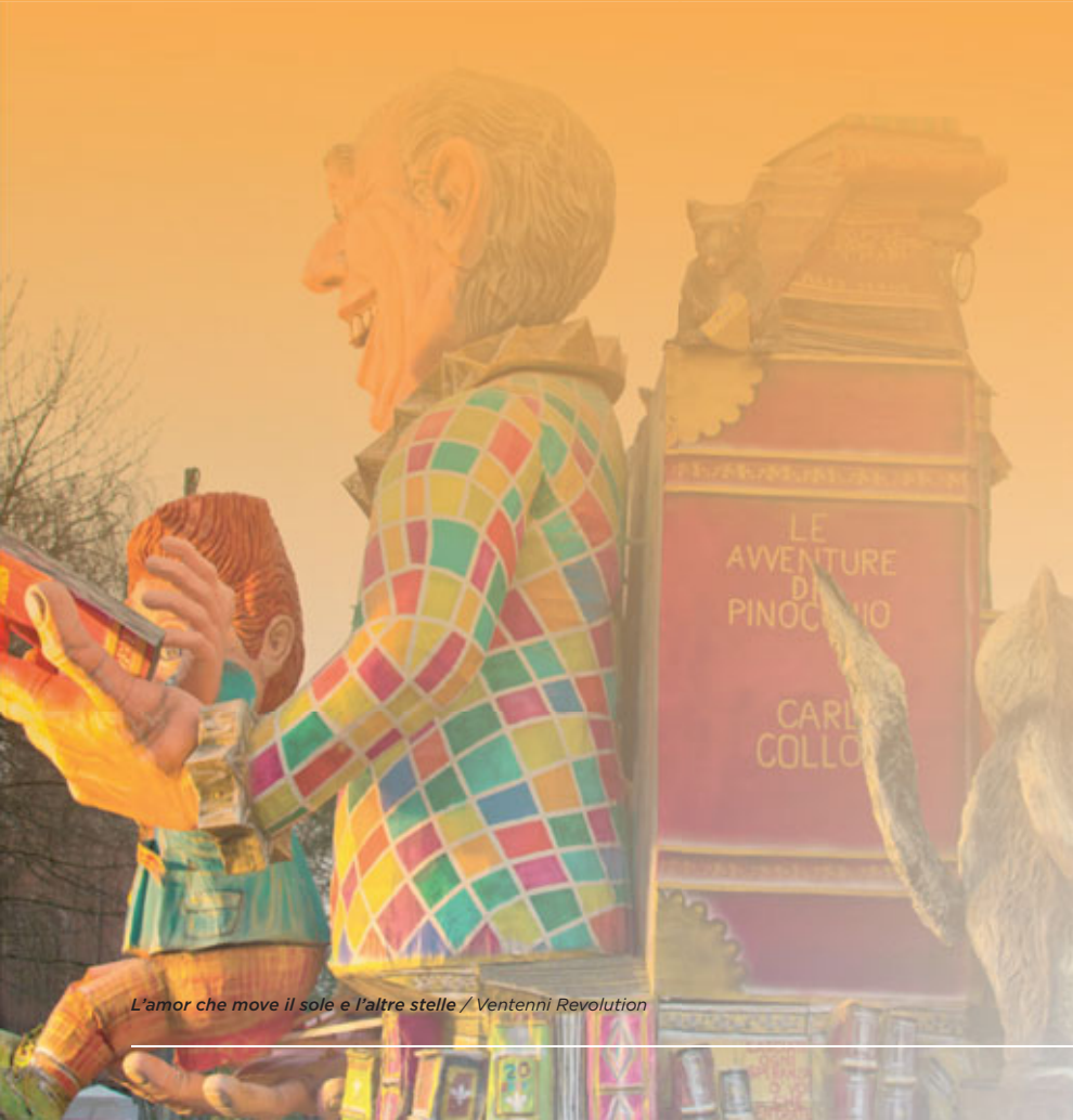
L'amor che move il sole e l'altre stelle / Ventenni Revolution