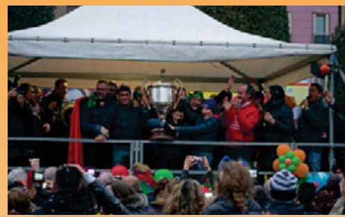
Il presidente della Regione Veneto Luca Zaia premia i vincitori