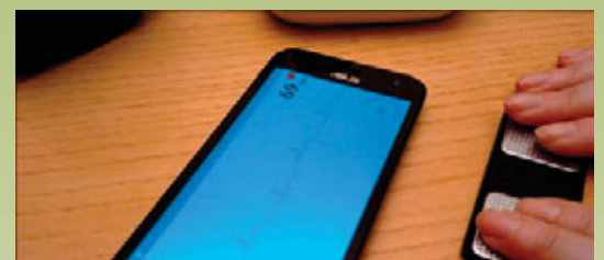
Alcune schermate della Mobile App di Teseo

coordinatore delle attività informatiche del Progetto Teseo