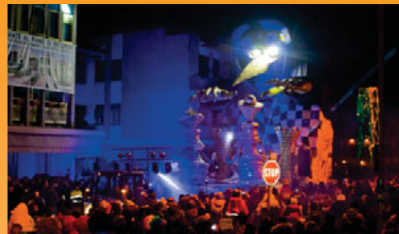
Scacco al Potere / Amici del Carnevale