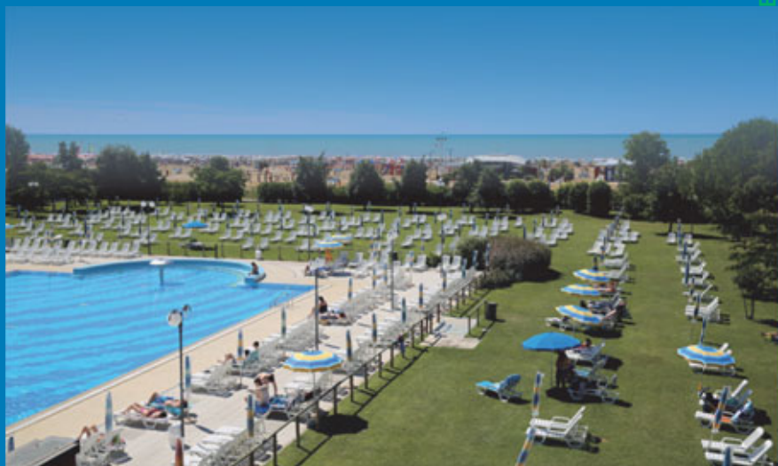
Veduta delle piscine termali all'aperto