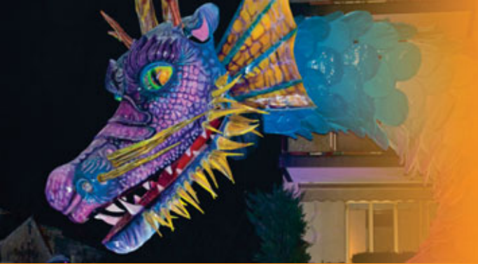
Amore Rubato / Simpatiche Canaglie

Tre gli eventi clou del Carnevale dei Ragazzi di Ceggia: la sfilata in notturna, con show e suggestivi giochi di luce; e poi le sfilate della domenica e del martedì grasso, aperte anche a compagnie e carri mascherati da fuori paese.